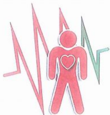
PRZYSPIESZONA CZYNNOŚĆ SERCA