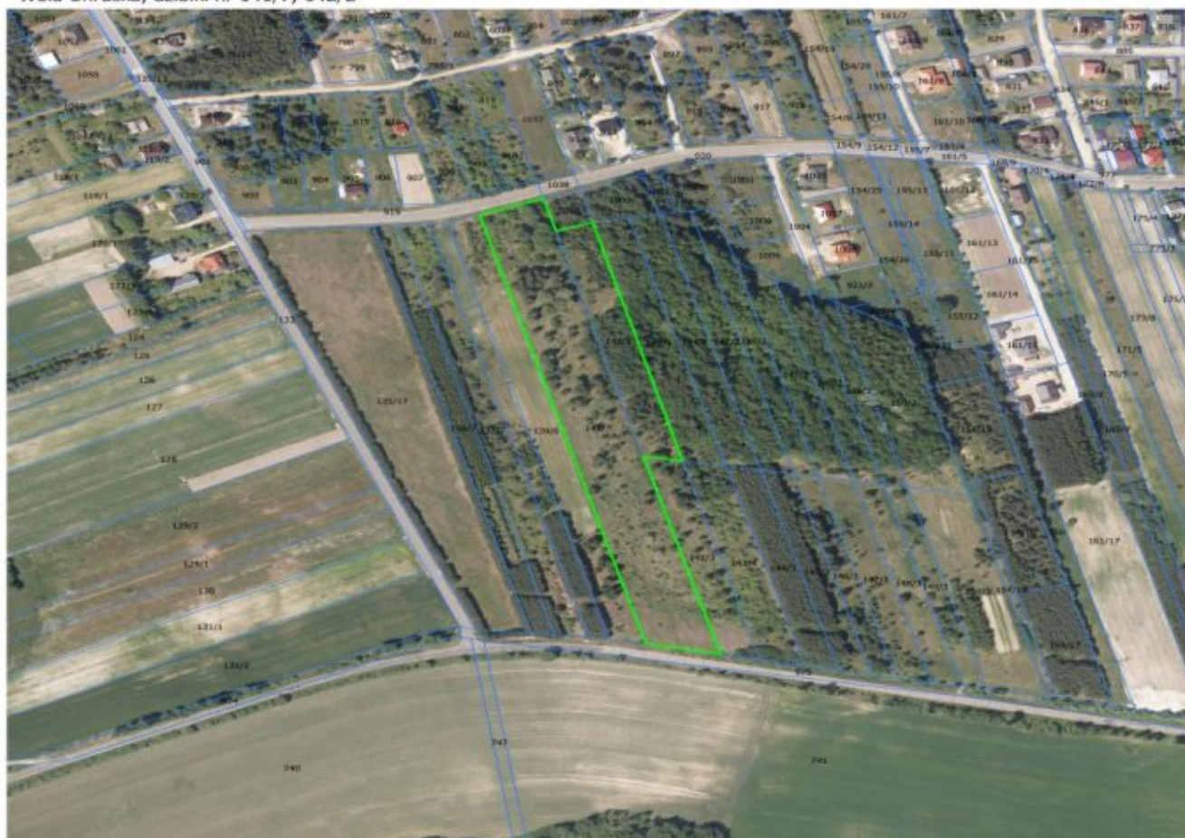
Wola Uhruska, działki nr 141/7, 142/2