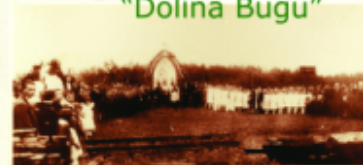
Podwójne Kapliczki Huty Szklanej Robotniczej "Nadbużanka" oraz Sztandaru Towarzystwa Gimnastycznego "Sokół" 24 czerwca 1928 roku.

Nadbużanka to osada robotnicza, powstała przy hucie szkła. Huta szkła została wybudowana w 1922 roku przez spółkę 53 udziałowców. Na początku był to drewniany budynek hali fabrycznej, w której pracowała jedna wana. Wyrabiano szkło apteczne i monopolowe. Później pobudowano wannę tafelnicką do wyrobu szyb. Obok hali fabrycznej umieszczono baraki dla robotników. Niebawem zaczęły powstawać drewniane, szalowane, dwurodzinne domy, kryte dachówką lub gontem, zdobione gankami i werandami. Niektóre z nich przetrwały niezmiennie do dzisiaj. Huta czynna była w czasie okupacji. W 1949 r. została upaństwowiona. W latach 1954 - 1962 przeszła gruntowną modernizację. Asortyment wyrobów był szeroki, zależny od składanych ofert i popytu. Powojenna huta produkowała szkło gospodarcze, osłony do liczników, wkłady do termosów. W 1995 r. hutę sprywatyzowano. Nowy właściciel uruchomił produkcję zniczy. Nie trwała ona jednak długo.