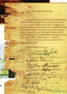
Dokument upamiętniający fundację krzyża