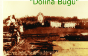
Podwójne Kapliczki Huty Szklanej Robotniczej "Nadbużanka" oraz Sztandaru Towarzystwa Gimnastycznego "Sokół" 24 czerwca 1928 roku.

Nadbużanka to osada robotnicza, powstała przy hucie szkła. Huta szkła została wybudowana w 1922 roku przez spółkę 53 udziałowców. Na początku był to drewniany budynek hali fabrycznej, w której pracowała jedna wana. Wyrabiano szkło apteczne i monopolowe. Później pobudowano wannę tafelnicką do wyrobu szyb. Obok hali fabrycznej umieszczono baraki dla robotników. Niebawem zaczęły powstawać drewniane, szalowane, dwurodzinne domy, kryte dachówką lub gontem, zdobione gankami i werandami. Niektóre z nich przetrwały niezmiennie do dzisiaj. Huta czynna była w czasie okupacji. W 1949 r. została upaństwowiona. W latach 1954 - 1962 przeszła gruntowną modernizację. Asortyment wyrobów był szeroki, zależny od składanych ofert i popytu. Powojenna huta produkowała szkło gospodarcze, osłony do liczników, wkłady do termosów. W 1995 r. hutę sprywatyzowano. Nowy właściciel uruchomił produkcję zniczy. Nie trwała ona jednak długo.