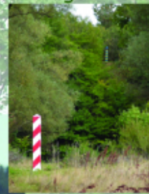
Ślasy graniczne Polski i Ukrainy