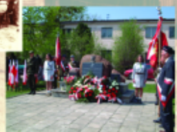
Uroczystość oddania pomnika

Z historią huty związana jest kapliczka ufundowana i wybudowana przez hutników Huty Szklanej Robotniczej „Nadbużanka”. Poświęcona została 24 VI 1928r. Odbływały się przy niej ważne dla lokalnej społeczności uroczystości religijne i patriotyczne: nabożeństwa majowe, czerwcowe, zgrupowanie z okazji pogrzebu J. Piłsudskiego, poświęcenie sztandaru NZS „Solidarność” huty szkła. Od roku 1986, kiedy została erygowana parafia w Woli Uhruskiej, rola kapliczki, jako miejsca kultu religijnego, zmalała. Obok kapliczki stoją dwa krzyże. Jeden ufundowany był przez udziałowców w jubileuszowym 1935 r. Drugi poświęcony jest, tak jak widoczny pomnik lotnemu oddziałowi AK „Nadbużanka” - pierwszemu oddziałowi partyzanckiemu na ziemi włodawskiej.