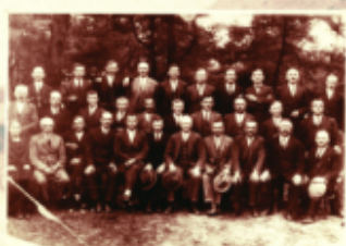
Udziałowcy Huty "Nadbużanka"