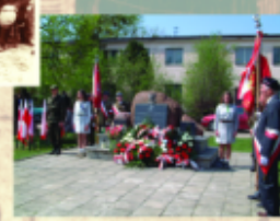
Uroczystość oddania pomnika

Z historią huty związana jest kapliczka ufundowana i wybudowana przez hutników Huty Szklanej Robotniczej „Nadbużanka”. Poświęcona została 24 VI 1928r. Odbływały się przy niej ważne dla lokalnej społeczności uroczystości religijne i patriotyczne: nabożeństwa majowe, czerwcowe, zgromadzenie z okazji pogrzebu J. Piłsudskiego, poświęcenie sztandaru NZS „Solidarność” huty szkła. Od roku 1986, kiedy została erygowana parafia w Woli Uhruskiej, rola kapliczki, jako miejsca kultu religijnego, zmalała. Obok kapliczki stoją dwa krzyże. Jeden ufundowany był przez udziałowców w jubileuszowym 1935 r. Drugi poświęcony jest, tak jak widoczny pomnik lotnemu oddziałowi AK „Nadbużanka” – pierwszemu oddziałowi partyzanckiemu na ziemi włodawskiej.