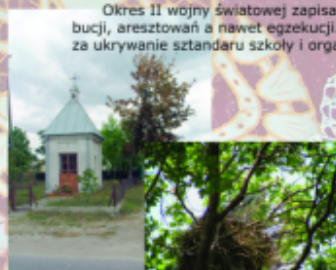
Kaplica w Bytyniu

Okres II wojny światowej zapisał się w pamięci jako czas kontrybucji, aresztowań a nawet egzekucji. Trzech mieszkańców rozstrzelano za ukrywanie sztandaru szkoły i organizacji strzeleckiej.