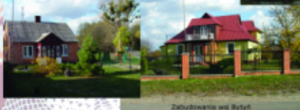
Zabudowania w Bytyni

Bytyń, podobnie jak Wola Uhruska zlokalizowany jest na terasie nadzalewowej opadającej w tym miejscu stromą piaszczystą skarpą w dno doliny. Zmiana podłoża skalnego i stosunków wodnych widoczna jest w odmiennych od poprzednich zespołach roślinnych. Na nasłonecznionej skarpcie spotkać można kocanki piaszkowe, rozchodniki, świerzbnicę polną, macierzankę piaszkową. Wysoka skarpa to miejsce widokowe na dolinę Bugu.