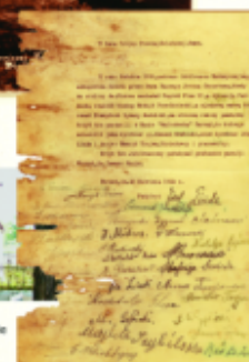
Dokument upamiętniający fundację krzyża