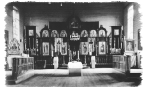
Wnętrze cerkwi w Zbereżu http://www.cerkiew1938.pl/zbereze.html