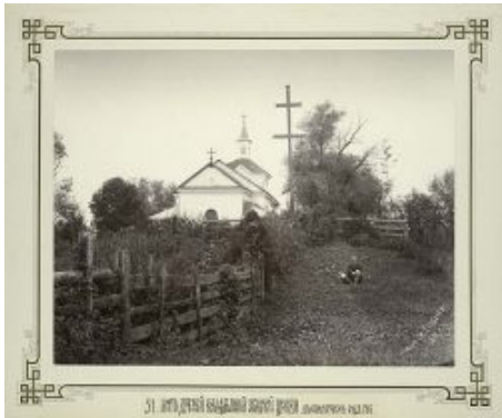
Cerkiew pw. Zaśnięcia NMP w Uhrusku, 1891 r. http://andcvet.narod.ru/XD/asd53.html