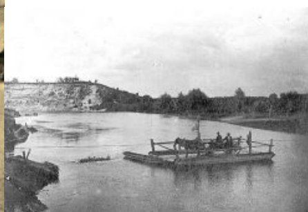
Prom na Bugu, Wola