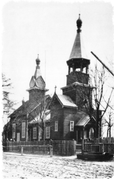
Cerkiew w Zbereżu, zburzona w 1938 r. http://www.cerkiew1938.pl/zbereze.html