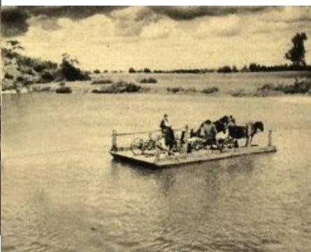
Prom na Bugu, Wola